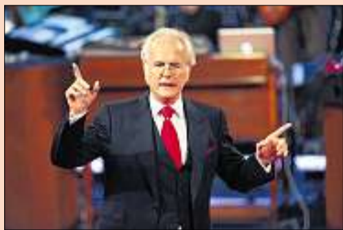
Am 3. Mai ist Schluss: Harald Schmidt. (Ky)

Am 3. Mai läuft zum letzten Mal die «Late Night Show» mit Harald Schmidt, wie der Sender Sat 1 gestern mitteilte. Wegen mieser Zuschauerzahlen ist «Dirty Harry» den Quotentod gestorben. Schmidt liess sich in einer Pressemitteilung von Sat 1 nur mit einem Wort zum Ende seiner Show zitieren: «Schade.» Obwohl