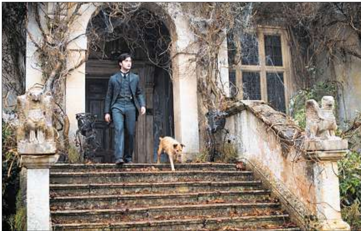
Auf den Stufen des Bösen: Anwalt Arthur Kipps (Daniel Radcliffe) vor dem Haus der «Woman in Black».