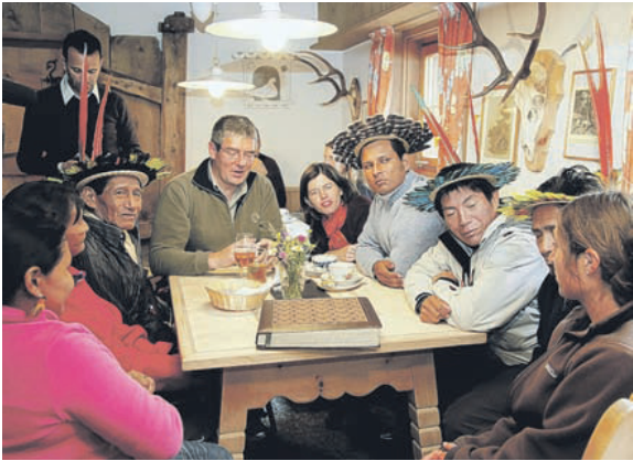
Eir il capo da Scuol s'ha ingaschà per muosar als Indians da la Brasilia co cha la vita in Engiadina Bassa funcziuna. A S-charl sun p.ex. eir gnüdas contempladas fotografias da chatscha veglias e novas.

In tschercha da lur ragischs – cun fermativa a Scuol