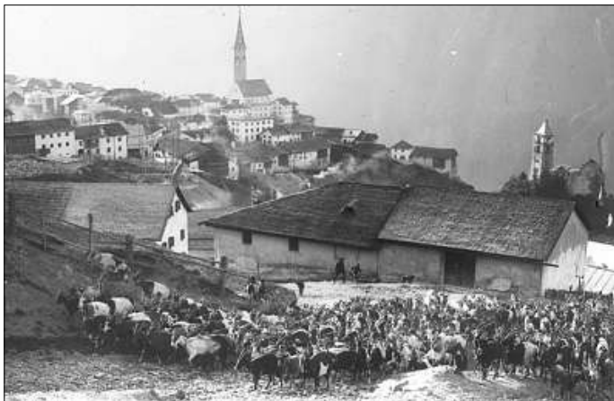
Üna trentina da quistas fotografias as po admirer in l'exposiziun.

eir bgeras fotografias. Diversas da quistas as po admirer in l'exposiziun. Ellas muossan differents aspets da la vita da minchadi, da festa e da temp liber. Uschè as vezza purtrets da persunas e scenas da lavur, cortegis da festas, plazzas e giassas da vschinaunchas, ma eir püssas scenas da sport da sted e d'in-