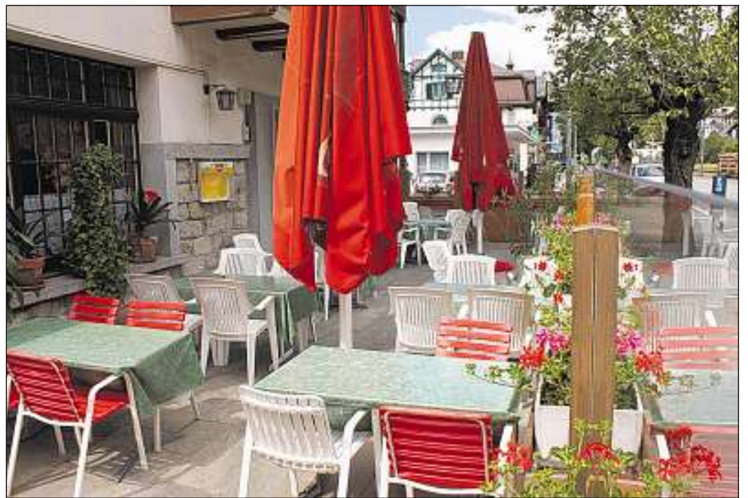
Ils ustiers a Glion ston spuentar ils hosps sin terrassa ils luverdis allas 23.00 e la fin d'jamna allas 24.00. Ina petiziun vul midar quei.