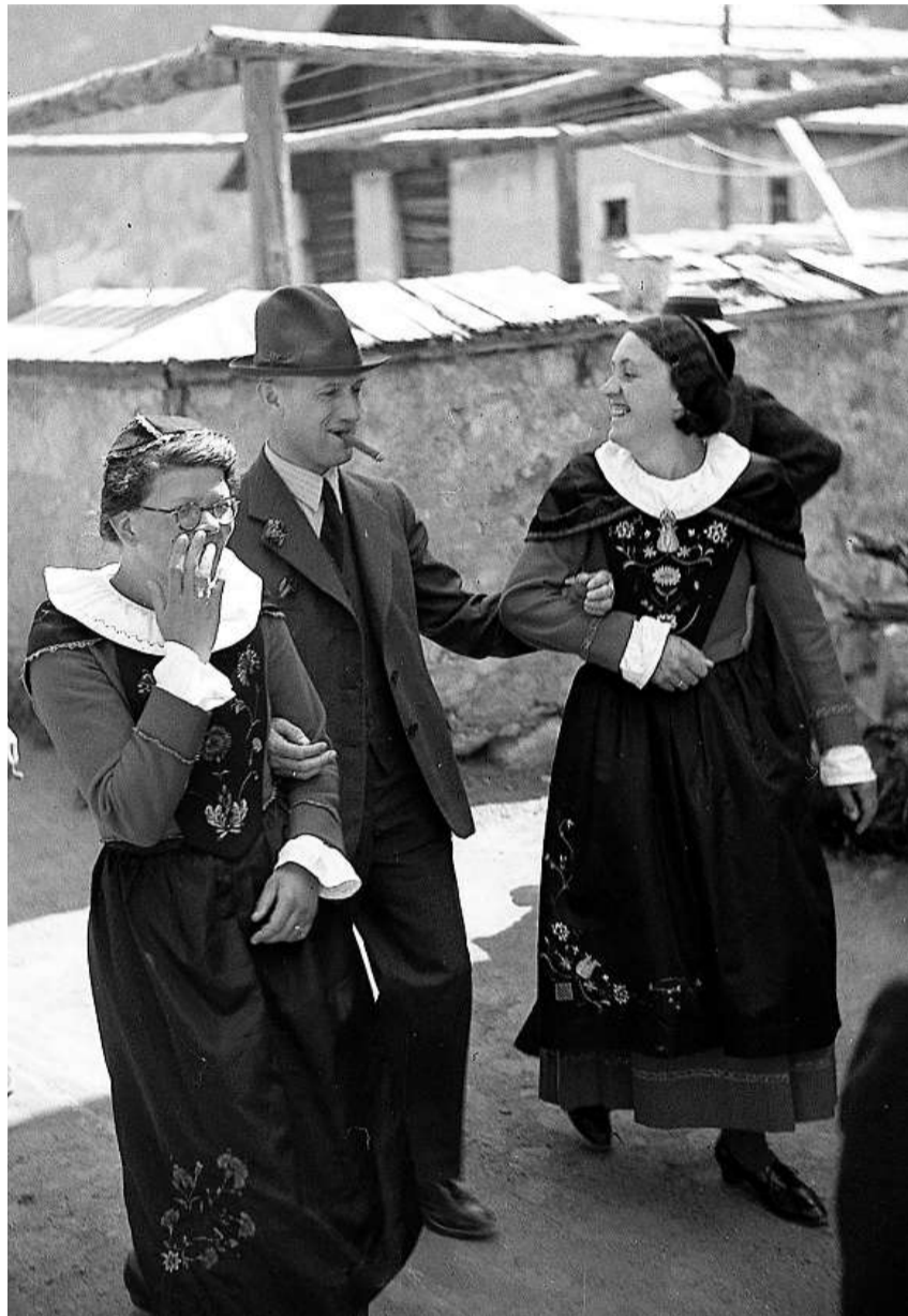
Schulterschluss mit einheimischem Brauchtum: Bundesrat Philipp Etter und seine Mitstreiter setzten im Abstimmungskampf auf die Mithilfe von Trachtenvereinen und Heimatschützern.

Wie kam es zu diesem erstaunlichen Resultat und wer unterstützte das Postulat der Rätoromanen? Diese Fragen standen im Zentrum der wissenschaftlichen Arbeit Valärs. Sie zu beantworten war laut Valär umso